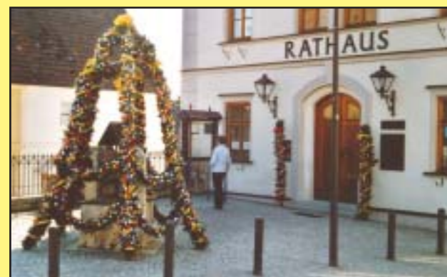
Der Große Osterbrunnen am Rathaus der Marktgemeinde Burgheim.