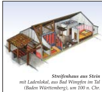
Streifenhaus aus Stein mit Ladenlokal, aus Bad Wimpfen im Tal (Baden Württemberg), um 100 n. Chr.

Damit sind wir bei den Handwerkern gelandet. Mindestens zwei Töpfereien mit mehreren Trennöfen hat man am östlichen Rand des römischen Burgheims entdeckt. Vor Ort wurde die normale Haushaltsware produziert. Am auffälligsten sind dabei die typischen Reibschalen. An der Innenwand dieser Gefäße befinden sich viele kleine Steinchen zum Verreiben von Gemüse und Kräutern. Ein Teil dieser Waren wurde sicherlich auch per Schiff Donau abwärts weiter transportiert. Das wichtigste Metall der Römer, aus dem sich fast ihre gesamten Werkzeuge herstellen, war das Eisen. Wie schon mehrfach berichtet, wurde das Eisen zu allen Zeiten, seit man das Metall verwendete, auch in unserem Gemeindebereich verhüttet. Wie der schon einmal erwähnte Fund von Schmelztiegelchen beweist, waren metallverarbeitende Handwerker sicher vor Ort. Und vermutlich auch Holzverarbeitende und steinhauende Handwerker, denn das Baumaterial Kalkstein gibt es in dem letzten Ausläufer der Schwäbischen Alp sowohl auf der Südseite der Donau sowie in östlicher Richtung bis Neuburg in rauen Mengen. Fortsetzung folgt im Zwoaring Nr. 178.