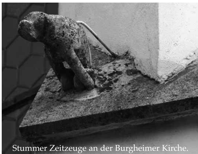
Stummer Zeitzeuge an der Burgheimer Kirche.

Die AOK bietet Rauchern zahlreiche Möglichkeiten, sich über das Thema zu informieren und mit der richtigen Einstellung zusammen mit der richtigen Methode das Rauchen erfolgreich aufzugeben. Weitere Einzelheiten unter der Telefon-Nummer: 0841 9349 145 . Darüber hinaus gibt es für alle medizinischen Fragen im Zusammenhang mit Sucht und Entwöhnung einen 24-Stunden-Telefon-Service „Clarimedis“ unter der Telefon-Nummer: 0 180 111 22 55 .