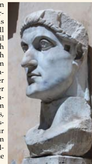
Kopfstatue Kaiser Konstantin