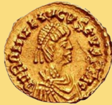
Tremissis des Romulus Augustulus, Kaiser Romulus Augustulus wurde nur auf Münzen abgebildet.

her ist bekannt, dass sich dort bis ca. zum Jahr 450 n. Chr. eine Besatzung halten konnte. Endgültig und „amtlich“ hörte Rätien auf als römische Provinz zu existieren, nachdem der germanische Heerführer Odoakar den letzten weströmischen Kaiser Romulus Augustulus im Jahre 476 absetzte und alle sich noch in den Provinzen befindenden Soldaten offiziell aufrief, in ihre Heimat Italien zurückzukehren.