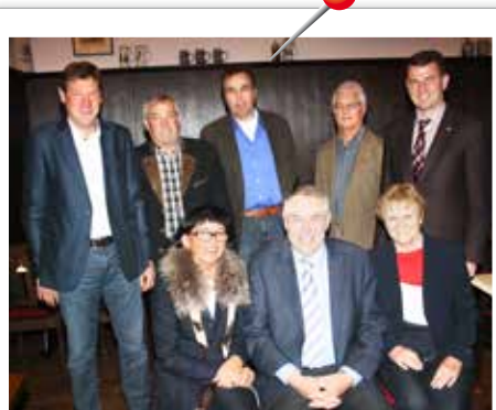
Wasserzweckverband Wasser war und ist ihr Leben. In einer kleinen Feierstunde wurden diese Verbandsräte des Wasserzweckverbandes Burgheimer Gruppe verabschiedet. Im Mai wird es neue Gesichter in diesem Gremium geben.