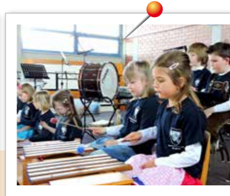
Musikalischer Nachwuchs zeigt Können Für viele Kinder war es der erste große Auftritt. Beim Vorspielnachmittag der Marktmusikkapelle Burgheim präsentierten 71 Kinder und Jugendliche einem begeisterten Publikum, was sie unter Anleitung ihrer engagierten Lehrer bislang gelernt haben.