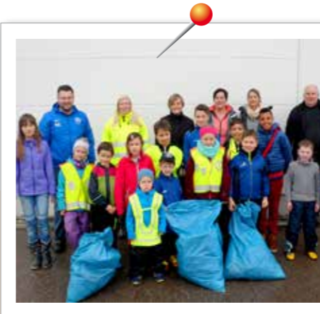
RAMADAMA der Jungfußballer Mit Feuereifer beteiligte sich die Jungen und Mädchen der Kleinfeldgruppe des TSV Burgheim an der alljährlichen „Ramadama-Aktion“ der Gemeinde, um Wege und Straßen von Unrat zu befreien.