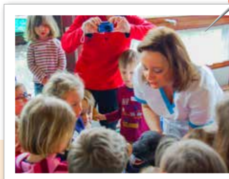
Zahnarztbesuch im Kindergarten Beim Besuch der Zahnarztpraxis Dr. Manuela Schiller im Kindergarten Burgheim lernten die Kinder alles Wichtige für gesunde schöne Zähne anhand des Theaterkins „Dentulus und das Füchlein“ und übten das Zähneputzen am LAGZ-Kuscheltier Goldie.