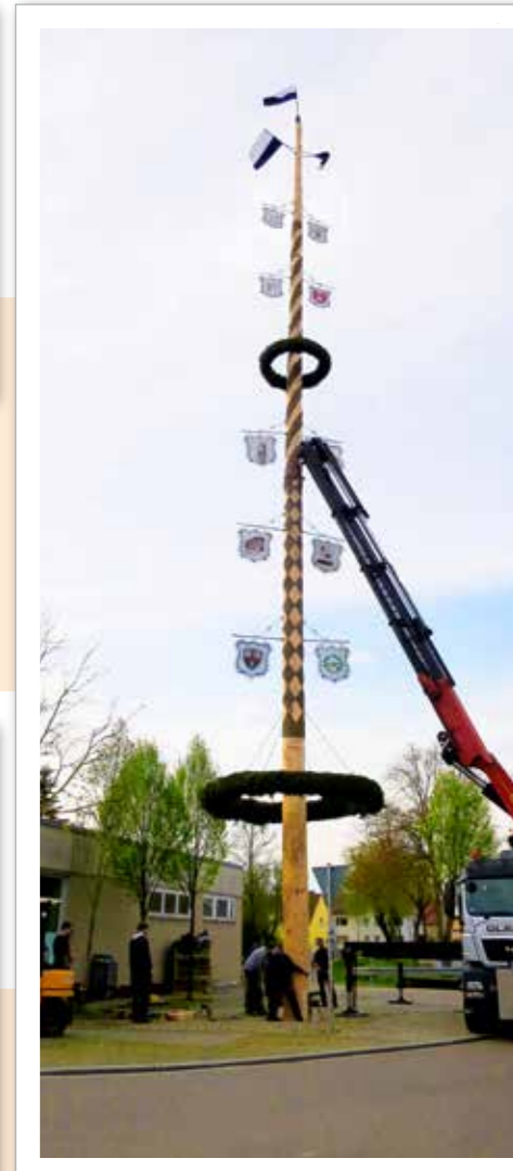
Burgheimer Maibaum misst 33 Meter Am Vorabend zum 1. Mai stellte der Katholische Burschenverein im Beisein der Markt- musikkapelle und vieler Gäste seinen Maibaum auf und feierte das Gelingen im Anschluss im aufgestellten Zelt.