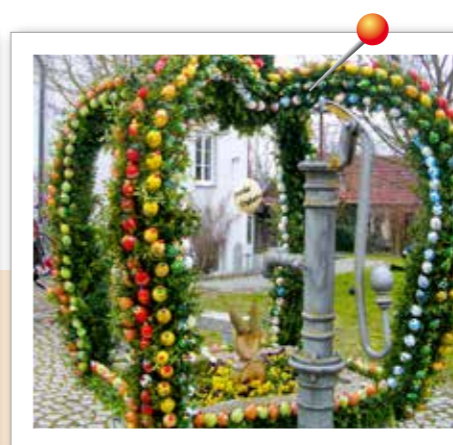
Osterbrunnen in Leidling Wie jedes Jahr fertigten auch heuer die Leidlinger Bastelfrauen einen mit vielen bunten Eiern verzierten Osterbrunnen in Form einer Krone und stellten diesen im Ortsteil Leidling auf.