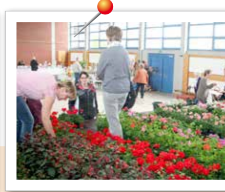
Blumentombola auf Burgheimer Maimarkt Viele Besucher kamen zum jährlichen Maimarkt des Gartenbauvereins Burgheim in die Schule, um Dekoartikel, Honig, Blumentöpfe, Bilder und Schmuck zu kaufen und ihre Blumengewinne abzuholen. In der Aula gab es dann noch Kaffee und Kuchen.