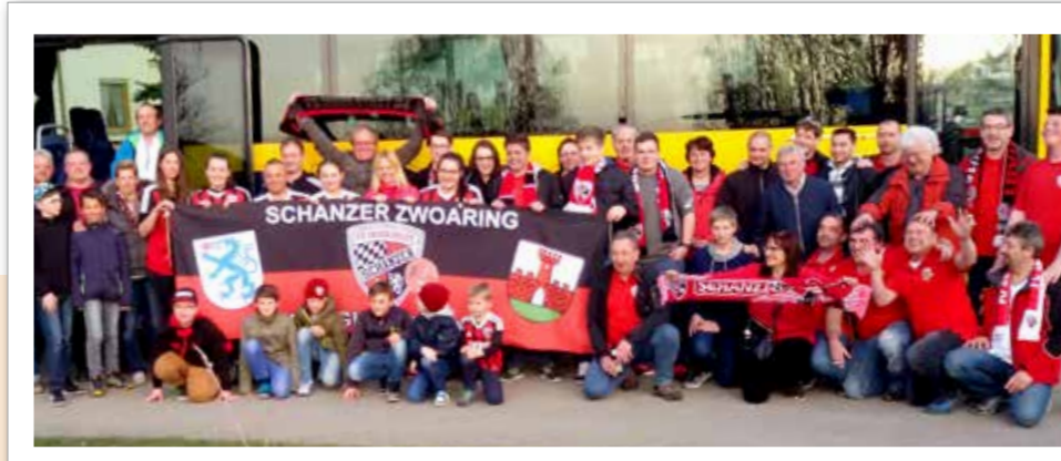
Fanclub Schanzer Zwoaring Burgheim/Straß Die zweite Busfahrt zu einem Spiel des FCI war ein voller Erfolg. Über 50 Fans unterstützen den FC Ingolstadt im Spiel gegen den FC Schalke und erlebten den bis dahin höchsten Sieg der Schanzer in deren noch jungen Bundesligakarriere.