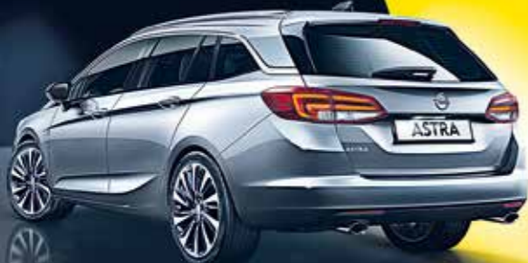
Abb. zeigt Sonderausstattungen.